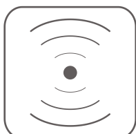
SRM Radio Wireless