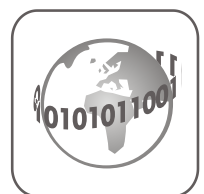
Global Online Data Acquisition