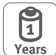
1 Years myCompolog Battery Lifetime