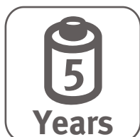
5 Years Sonde Battery Lifetime